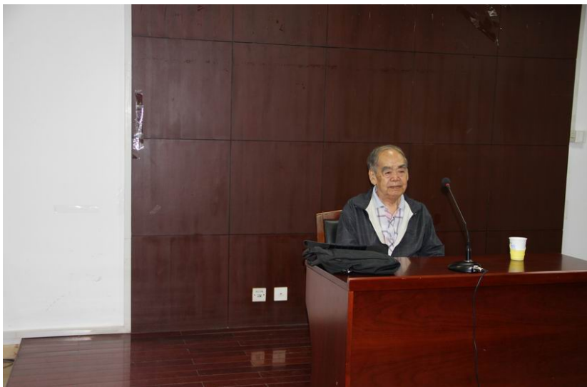
杜维运先生在作报告

著名中国史学史研究学者、曾任教于台湾大学历史系和香港大学中文系的杜维运教授，于 2011 年 9 月 14 日来我中心做了题为“中西史学的会通”的学术报告。